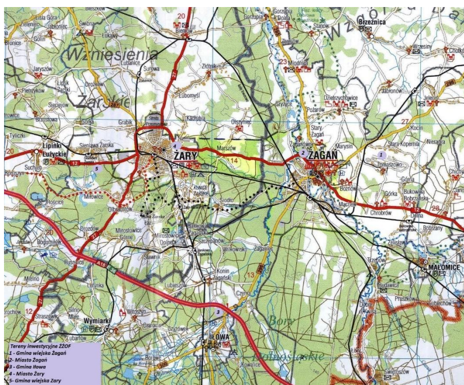
Mapa 1 Tereny inwestycyjne na obszarze gmin ŻŻOF

Każda z gmin przygotowała własne propozycje dodatkowych wydatków inwestycyjnych w tym zakresie. Wspólne mogą być w przyszłości działania promocyjne w celu przyciągnięcia do regionu ŻŻOF nowych inwestorów. Lokalizację działek przewidzianych do uzbrojenia przedstawia mapka poniżej.